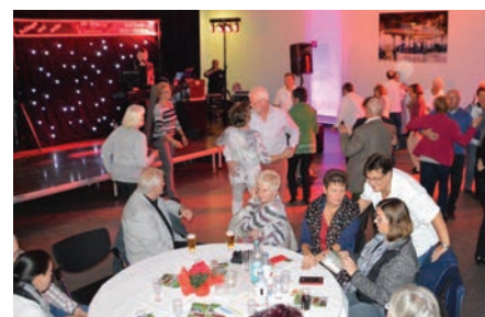
UM ACHT AM SCHACHT, 22.11.